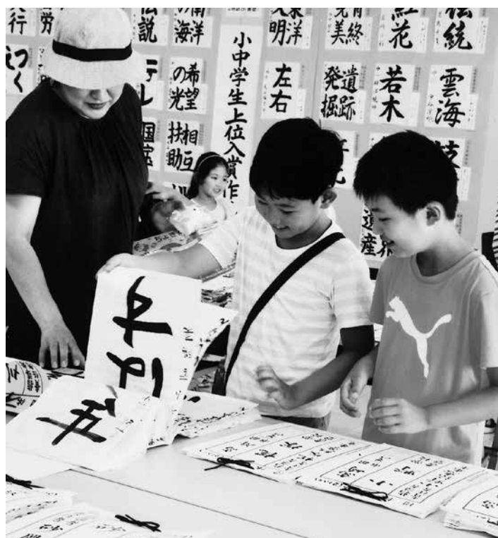
第76回展覧会場風景（群馬県JAビルと昌賢学園まえばしホール）